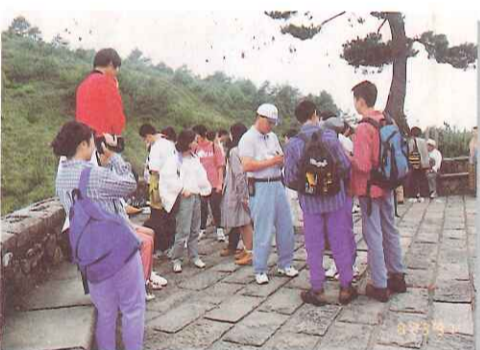
▲日本宮崎大學養護學校師生及家長與本校師生及家長玉山健行