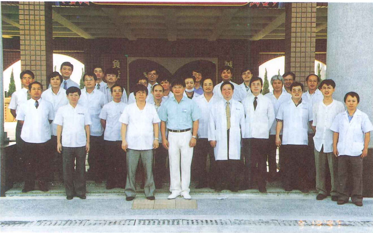
▲牙醫師公會邱理事長率27位牙醫師至本校為學生進行口腔齶齒檢查