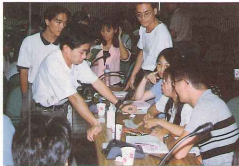
▲與會之新進教師熱烈參與討論