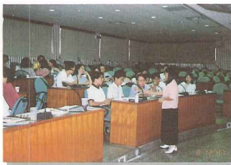
▲新進教師參與研習一景